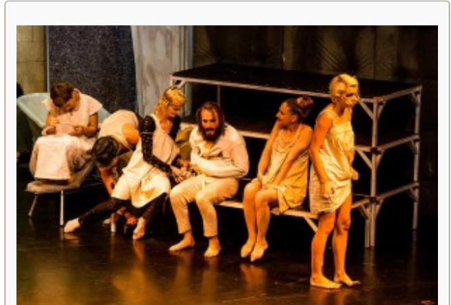
Die "Insassen" der Anstalt

Das Bühnenbild spricht bereits Bände. Neben dem noch geschlossenen Vorhang steht ein alter Tisch mit einer vorsintflutlichen Schreibmaschine, und neben anderen Utensilien aus der Mitte des vergangenen Jahrhunderts hängt ein Foto von Sigmund Freud an der schäbigen Wand. Die schriftliche Einblendung klärt dann die Ausgangssituation. Ein junger Adliger wird im Jahr 1947 wegen homosexueller Unzucht in eine Irrenanstalt – ein damals noch durchaus geläufiger Begriff – eingeliefert und erhält von dem schmierigen Chef (Collin Brothers), der wohl in der gerade zugrunde gegangenen Kurzepeche sicher eine "gute Figur" gemacht haben dürfte, eine mehr derbe als herzliche Einweisung. Schon hier zeigt diese Show deutliche Sozialkritik, wenn auch an einer verflochtenen Zeit.